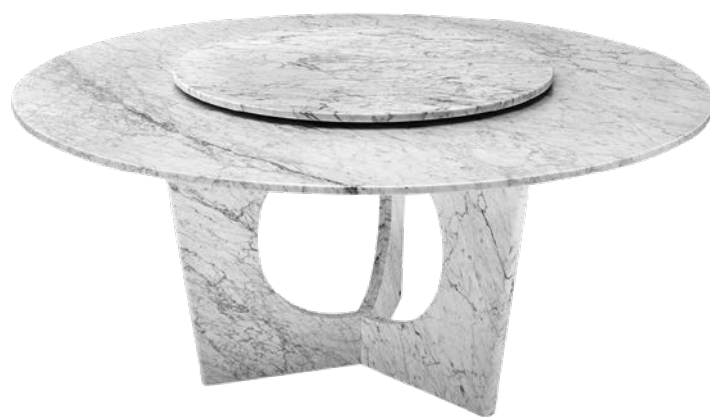
Table 986, This Weber pour Rolf Benz rolf-benz.com et thisweber.com

La table rectangulaire est un classique occidental, une référence alpine, un insubmersible des intérieurs professionnels et privés. Avec le modèle 986, le designer zurichois This Weber marie les contraires et offre au public européen un morceau de culture orientale. En l'occurrence, une table ronde en pierre naturelle qui s'inspire des rituels culinaires chinois, parfaite pour la communication de tous les convives. Elle est surmontée d'un plateau tournant qui se révèle toujours une astuce incroyablement ludique et pratique pour la circulation des plats. Disponible en marbre de Carrare ou dans une version dite Graphit Brown, son piètement offre en outre une belle anamorphose du plateau susmentionné.